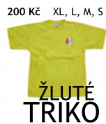
200 Kč XL, L, M, S