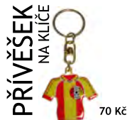
PŘÍVĚŠEK NA KLÍČE 70 Kč