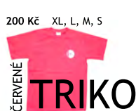
200 Kč XL, L, M, S ČERVENÉ TRIKO