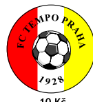
10 Kč SAMOLEPKA