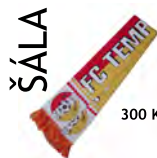
ŠÁLA 300 Kč