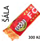
ŠÁLA 300 Kč