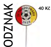
ODZNAK 40 Kč