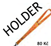
HOLDER 80 Kč