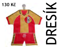
130 Kč DRESÍK