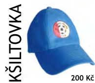
KŠILTOVKA 200 Kč