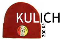
KULICH 200 Kč