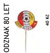
ODZNAK 80 LET 40 Kč