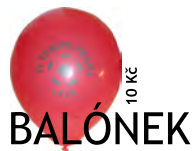
BALÓNEK 10 Kč