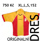
750 Kč XL, L, S, 152 ORIGINALNÍ DRES