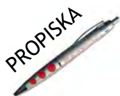
PROPISKA 30 Kč