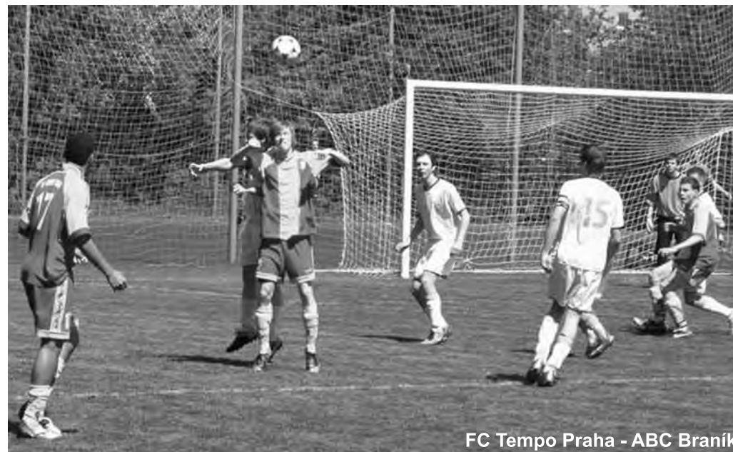
FC Tempo Praha - ABC Braník