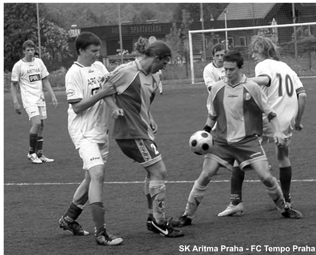
SK Aritma Praha - FC Tempo Praha