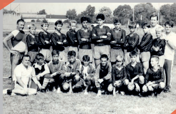
FC Tempo Praha – 1. místo v Pražském přeboru starších žáků 1990/1991