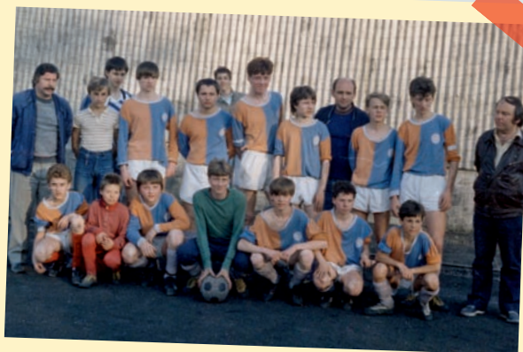
TJ Tempo Praha – 1. místo v Pražském přeboru mladšího dorostu 1988/1989