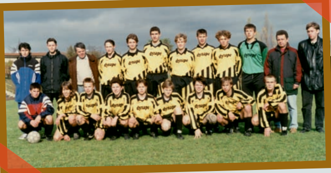
FC Tempo Praha – 1. místo v Pražském přeboru staršího dorostu 1996/1997