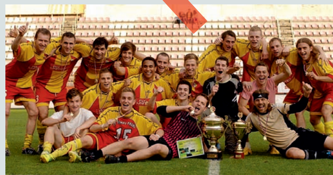
FC Tempo Praha – vítězství v Poháru PFS a postup do 1. kola Českého poháru 2013