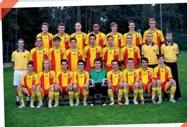
FC Tempo Praha – 1. místo v Pražském přeboru staršího dorostu 2013/2014