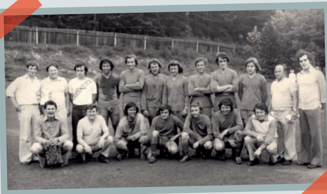
Sokol Lhotka po postupu ze III. třídy - 1976