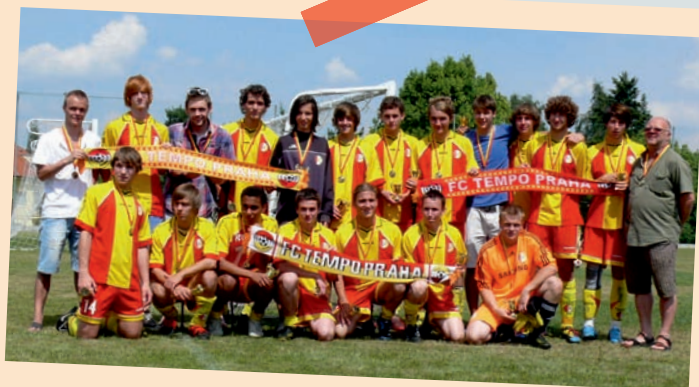
FC Tempo Praha – 1. místo v Pražském přeboru mladšího dorostu 2010/2011