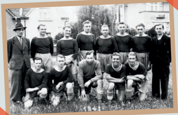
A.F.K. Zátíší v r.1941