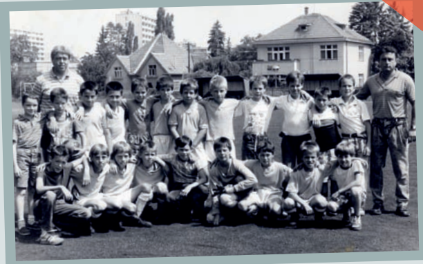
TJ Tempo Praha – 1. místo v Pražském přeboru starších přípravek 1988/1989