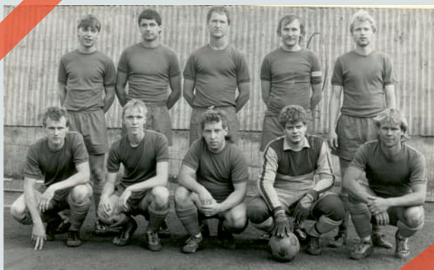
TJ Tempo Praha - Pražský přebor 1988/1989