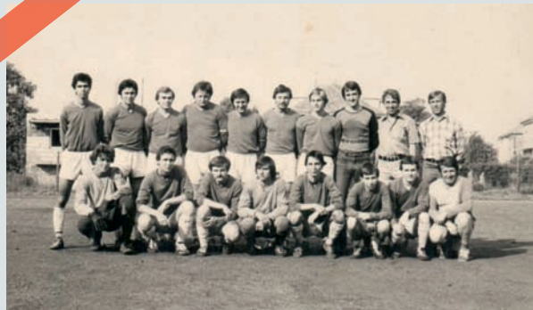
TJ Tempo Praha – první postup do Pražského přeboru 1981/82