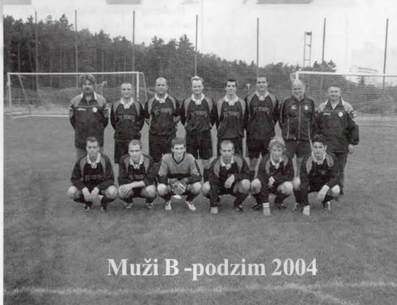
Muži B -podzim 2004

Zatím jsem se více než se soupeři seznamoval s jejich výsledky. I tak si ale myslím, že to bude o nakopání. Když si nenecháme nakopat a dokážeme hrát fotbal, měli bychom o postup bojovat. Zda se tyhle první předpoklady naplní, ukáže až sezona.