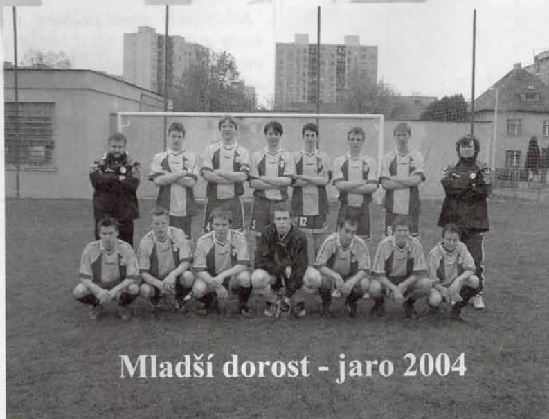
Mladší dorost - jaro 2004