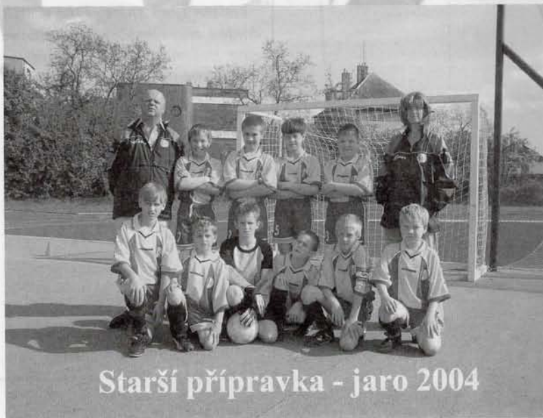
Starší příprava - jaro 2004