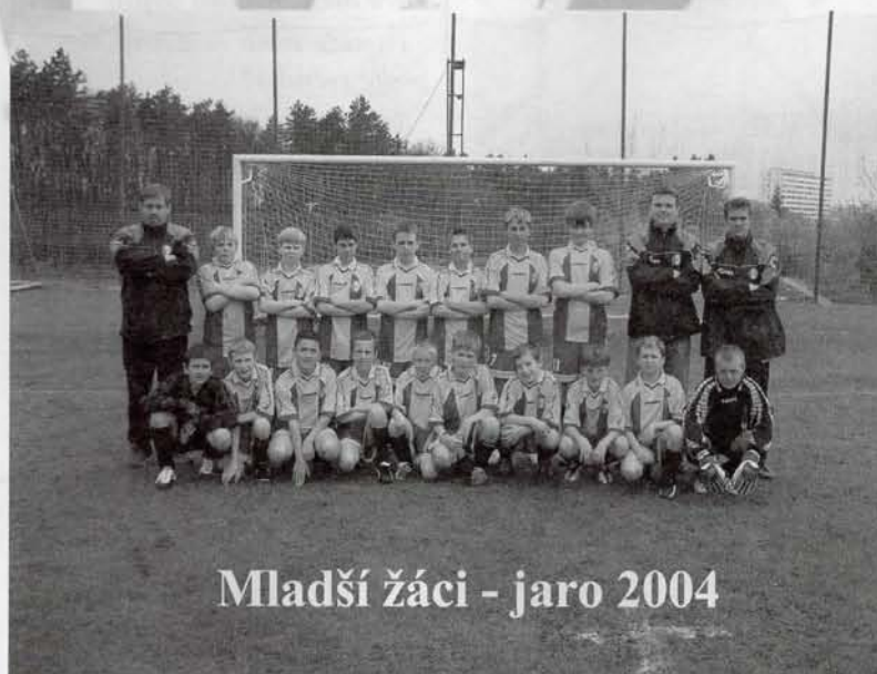
Mladší žáci - jaro 2004

Od každého trochu. Budeme pracovat na fyzice i na technice. Po taktické stránce se pak mladší hráči budou seznamovat s tím, co je to ofsajd. A to může být pěkný oříšek.