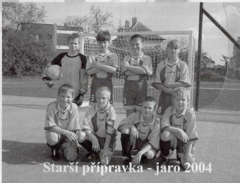
Starší přípravka - jaro 2004