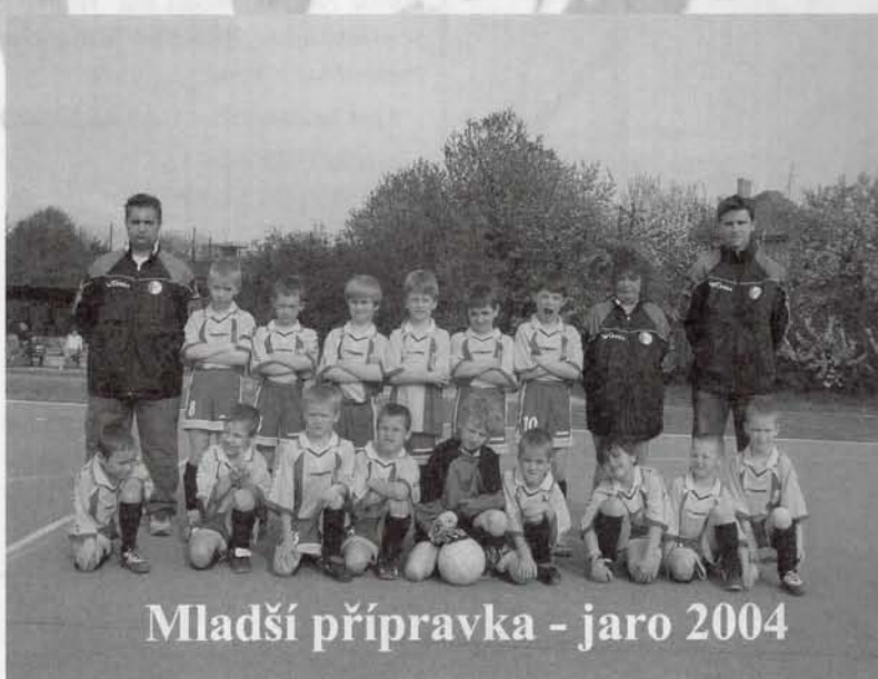
Mladší přípravka - jaro 2004

Já myslím, že určitě. Jako trenéři se budeme moci klukům víc věnovat. Složení týmů se tím sice trochu narušilo, ale to se rychle srovná a pak to bude v pohodě.