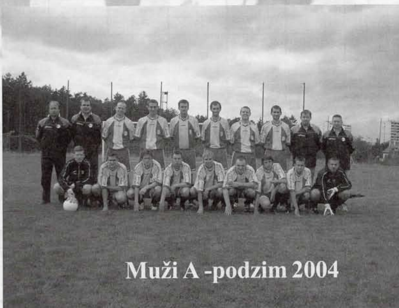
Muži A -podzim 2004