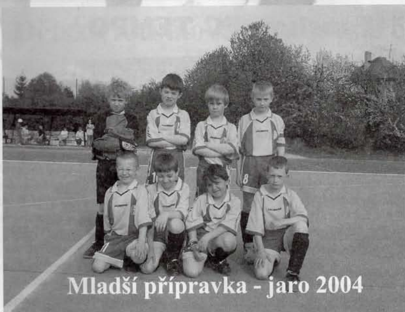
Mladší přípravka - jaro 2004

Nějak speciálně jsme se na to nepřipravovali, ale určitě to zvládneme. Když budou zlobit, tak je taky pozlobíme nějakým fotbalovým cvičením a ono se to určitě srovná. Od toho jsme na ně také dva, ne?