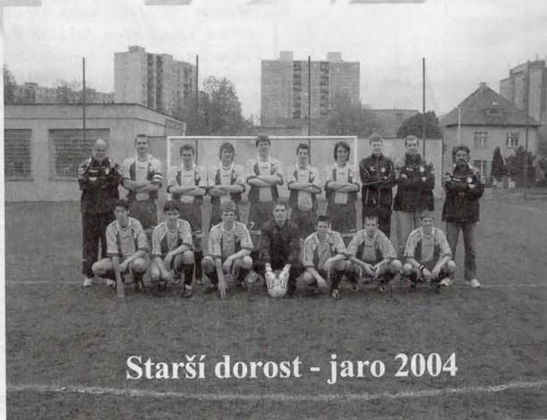
Starší dorost - jaro 2004

Z herních činností to budou především standardní situace. Také se budeme tlačit do hry bez posledního. Se čtyřmi obránci v řadě jsme dosud nehráli, takže to bude pro kluky trochu novinka.