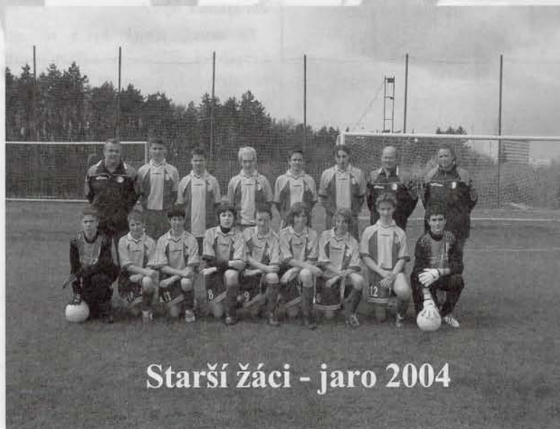
Starší žáci - jaro 2004

Nikdy jsem neměl problém dát kluky dohromady. Musí být mezi nimi určitá tolerance a přesuny mohou partu oživit. Kdyby hráli stále spolu pouze ve stejné sestavě, vytvořily by se jasné pozice. Někteří hráči by si mohli zvyknout na pozice šéfů a to by určitě nebylo dobře.